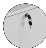
Portes à verrou