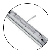
Transformateur intégré au cadre