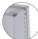
Led tangentielle sur les verticales