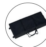
Sacs à roulettes